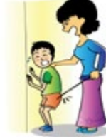
វាយធំ ឬធ្វើឲ្យកុមារឈឺចាប់ ជាអ្វីយ៉ាងណា ដើម្បីរឹតសាយភ័យខ្លួនឯង