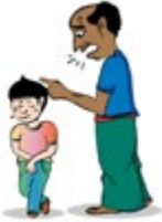
រំលោភបំពានដោយប្រើពាក្យសម្តីមិនល្អចំពោះកុមារ