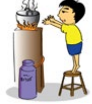
ទុកកុមារចោលគ្មានអ្នកមើលថែ