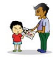
នាំឲ្យកុមារឃើញសកម្មភាពឬរូបអាសអាភាសផ្លូវភេទ