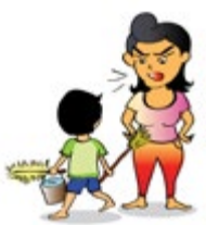
ប្រើប្រាស់កុមារធ្វើជាអ្នកបម្រើ