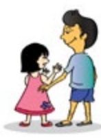
ប៉ះពាល់លើកុមារនៅផ្នែកណាមួយនៃរាងកាយដែលកុមារមិនចង់ឲ្យប៉ះ