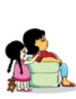
មិនស្តាប់សំដីកុមារ