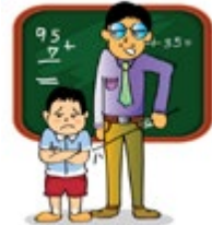
វាយធំ និងសើចង់អកឲ្យកុមារនៅសាលារៀន