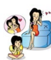
មិនយកចិត្តទុកដាក់លើសេចក្តីត្រូវការផ្នែកសតិអារម្មណ៍របស់កុមារ