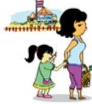
មិនយកចិត្តទុកដាក់លើតម្រូវការផ្នែកអប់រំរបស់កុមារ