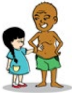
បង្ខំកុមារឲ្យប៉ះពាល់ផ្នែកណាមួយនៃរាងកាយរបស់ខ្លួន