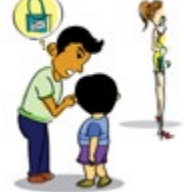
ចោកបញ្ឆោតកុមារ