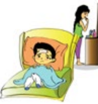
មិនយកចិត្តទុកដាក់លើតម្រូវការផ្នែកសុខភាពរាងកាយរបស់កុមារ