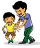
និយាយលួកលានលើកុមារដែលមិនចាំបាច់