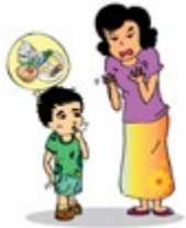
មិនយកចិត្តទុកដាក់ថែទាំកុមារដូចជាមិនសម្លាត ល្អិតល្អនិងឲ្យចំណីអាហារ