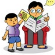
ធ្វើឲ្យកុមារបាត់បង់ទំនុកចិត្តលើខ្លួនឯង