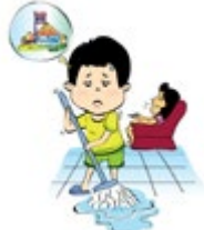
ធ្វើឲ្យកូនរបស់ខ្លួនក្លាយជា "អ្នកបម្រើ" ដោយមិនឲ្យមានពេលវេលារំលឹកនិងសិក្សា