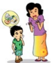
មិនយកចិត្តទុកដាក់ថែទាំកុមារដូចជាមិនសម្លាត់ ស្លៀកពាក់ និងឲ្យចំណីអាហារ