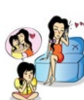
មិនយកចិត្តទុកដាក់លើសេចក្តីត្រូវការផ្នែកសតិអារម្មណ៍របស់កុមារ