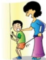
វាយដំ ឬធ្វើឲ្យកុមារឈឺចាប់ ជាដើម យ៉ាងណា ដើម្បីរំលោភកំហឹងខ្លួនឯង