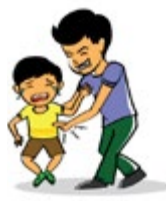
និយាយលួកលានលើកុមារដែលមិនចាំបាច់