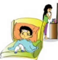
មិនយកចិត្តទុកដាក់លើតម្រូវការផ្នែកសុខភាពរាងកាយរបស់កុមារ