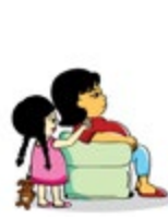
មិនស្តាប់សម្តីកុមារ