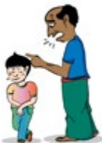
រំលោភបំពានដោយប្រើពាក្យសម្តីមិនល្អចំពោះកុមារ