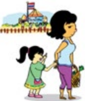
មិនយកចិត្តទុកដាក់លើតម្រូវការផ្នែកអប់រំរបស់កុមារ