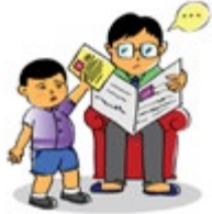
ធ្វើឲ្យកុមារបាត់បង់ទំនុកចិត្តលើខ្លួនឯង