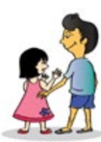
ប៉ះពាល់លើកុមារនៅផ្នែកណាមួយនៃរាងកាយដែលកុមារមិនចង់ឲ្យប៉ះ