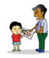
នាំឲ្យកុមារឃើញសកម្មភាពឬរូបអាសអាភាសផ្លូវភេទ