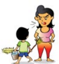
ប្រើប្រាស់កុមារធ្វើជាអ្នកបម្រើ