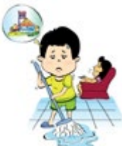
ធ្វើឲ្យកូនរបស់ខ្លួនក្លាយជា "អ្នកបម្រើ" ដោយមិនឲ្យមានពេលវេលាសម្រាក និងសីក្សា