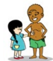
បង្ខំកុមារឲ្យប៉ះពាល់ផ្នែកណាមួយនៃរាងកាយរបស់ខ្លួន