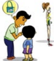
ចោកបញ្ឆោតកុមារ