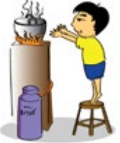
ទុកកុមារចោលគ្មានអ្នកមើលថែ