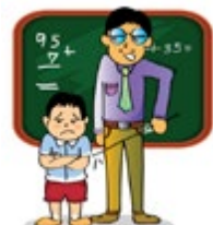
វាយដំ និងសើចង់អកឲ្យកុមារនៅសាលារៀន