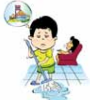
ใช้งานบุตรหลานของตนเองจนเกินควร จนส่งผลให้เด็กสูญเสียโอกาสในการเรียน และเล่นตามประสาเด็กทั่วไป