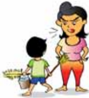
ใช้แรงงานเด็กเสมือนเป็นคนรับใช้ในบ้าน