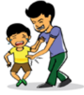
การแก้งและหยอกล้อที่เกินควรทำให้เด็กรู้สึกไม่สบายใจ มองค่าตัวเองต่ำ หรือเกิดความไม่มั่นใจในการแสดงความคิดเห็น และการแสดงออกที่สร้างสรรค์