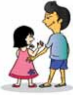
การสัมผัสร่างกายเด็กในที่ ๆ เด็กไม่ยากให้สัมผัส