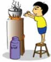
ปล่อยให้เด็กอยู่ตามลำพังโดยไม่ดูแล