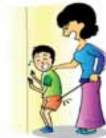
ทุบตีหรือทำร้ายเด็กเพื่อระบายอารมณ์ของตัวเอง