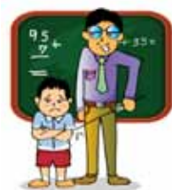
ตีและทำให้เด็กอายในโรงเรียน