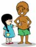
บังคับให้เด็กสัมผัสร่างกายคนอื่นในที่ที่ไม่ควรสัมผัส (เช่น อวัยวะสงวนทางเพศ หรืออวัยวะเพศ)