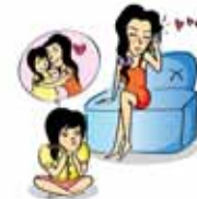
ละเลยความต้องการทางจิตใจของเด็ก