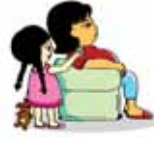
การเพิกเฉย ไม่สนใจเด็ก