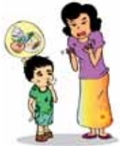
ละเลยไม่ดูแลเด็ก เช่น ปล่อยให้เด็กสกปรก ไม่มีเสื้อผ้า เครื่องนุ่งห่มและขาดอาหาร