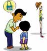
ใช้เด็กเป็นเครื่องมือให้ทำในสิ่งที่ต้องการ