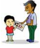
การเพิกเฉย ไม่สนใจให้เด็กได้เห็นและรับรู้พฤติกรรมรวมไปถึงสื่อลามก