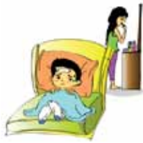
ละเลยความต้องการทางแพทย์ของเด็ก