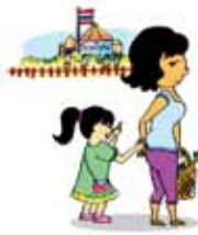
ละเลยความต้องการทางการศึกษาของเด็ก