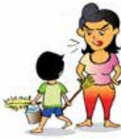
ใช้แรงงานเด็ก