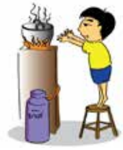
ปล่อยให้เด็กอยู่ตามลำพัง โดยไม่มีผู้ดูแล