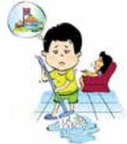
ใช้งานเด็กไม่เี่เวลาเรียน เล่น หรือพักผ่อน