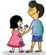
สัมผัสตามร่างกายเด็ก ในท่ีๆ เด็กไม่ยอมให้จับ