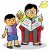
ทำลายความมั่นใจของเด็ก