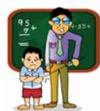
ตีและเยาะเย้ยเด็กในโรงเรียน