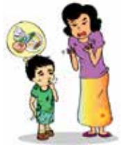
ละเลยไม่ดูแล เช่น ปล่อยให้เด็ก สกปรกขาดอาหารและไม่มี เสื้อผ้าใส่