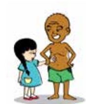
บังคับให้เด็กจับต้องคุณ