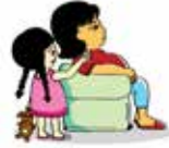
เพิกเฉยต่อเด็ก