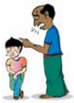
ดุด่าเด็ก