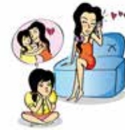
ละเลยความต้องการ ทางจิตใจของเด็ก