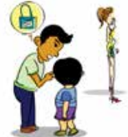
ครอบงำความคิด/การกระทำ ของเด็กและใช้เด็กเป็นเครื่องมือ