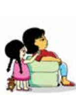
Phớt lờ trẻ