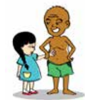
Ép buộc trẻ sờ mó vào cơ thể mình