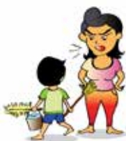
Sử dụng trẻ như một nô lệ