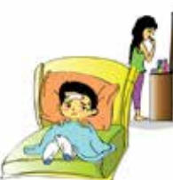
Không quan tâm tới nhu cầu chăm sóc sức khỏe của trẻ