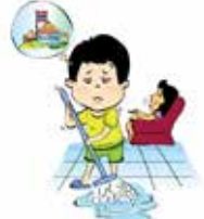
Bắt trẻ làm việc quá nhiều ảnh hưởng tới việc học tập, vui chơi của trẻ