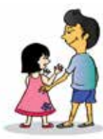
Sờ mó những bộ phận riêng tư trên cơ thể trẻ