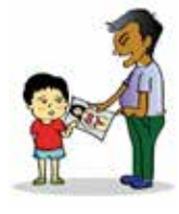
Cho trẻ xem phim, ảnh, ấn phẩm có nội dung đồi trụy