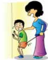
Đánh đập hoặc làm tổn thương trẻ