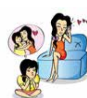
Phớt lờ nhu cầu được yêu thương của trẻ