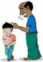
Xâm hại bằng lời nói