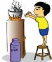
Bỏ mặc, không giám sát trẻ