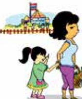
Không quan tâm tới nhu cầu học tập của trẻ