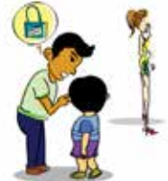
Dụ dỗ trẻ