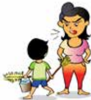
Sử dụng trẻ như một nô lệ