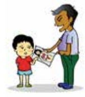
Cho trẻ xem phim, ảnh, ấn phẩm có nội dung đồi trụy