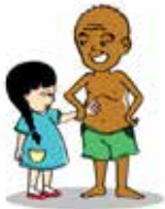
Ép buộc trẻ sờ mó vào cơ thể mình