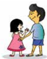
Sờ mó những bộ phận riêng tư trên cơ thể trẻ