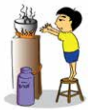
Bỏ mặc, không giám sát trẻ