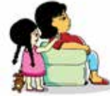
Phớt lờ trẻ