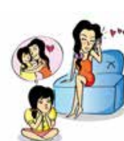
Phớt lờ nhu cầu được yêu thương của trẻ