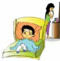
Không quan tâm tới nhu cầu chăm sóc sức khỏe của trẻ