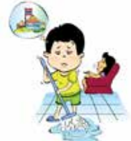
Bắt trẻ làm việc quá nhiều ảnh hưởng tới việc học tập, vui chơi của trẻ