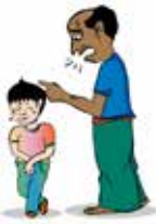
Xâm hại bằng lời nói