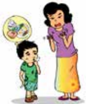
Không chăm sóc trẻ, ví dụ: không tắm rửa, thay quần áo, cho trẻ ăn uống