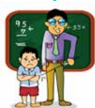
Đánh đập và nhạo báng trẻ ở trường học