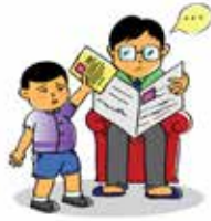
Xâm phạm sự riêng tư của trẻ