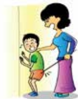
Đánh đập hoặc làm tổn thương trẻ