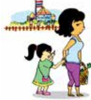
Không quan tâm tới nhu cầu học tập của trẻ